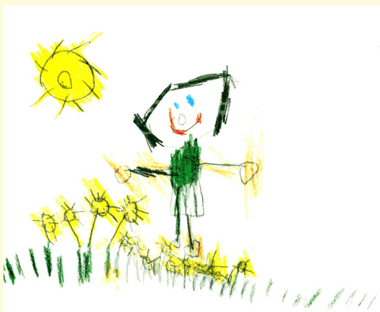
6 jaar, 9p24 deletie

Volgens de literatuur zijn de nagels vierkant, maar dit was slechts bij de helft van de Unique-kinderen het geval. Een gezin merkte op dat de nagels van hun dochter ribbelig waren (Alfi 1976; Young 1983; Al-Awadi 1988; U).